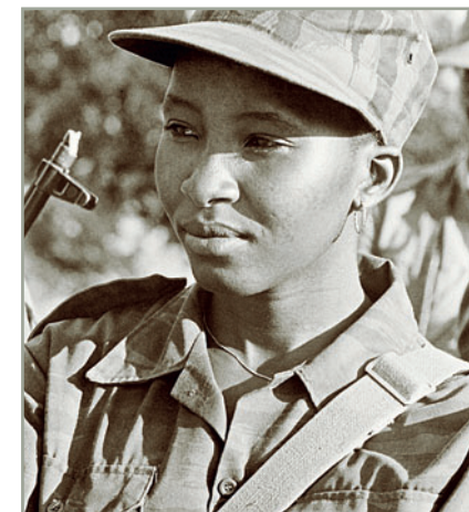
Боец ПЛАН, фото Дж. А. Либенберга, ЮАР

После апрельской 1974 года революции в Португалии, когда новые