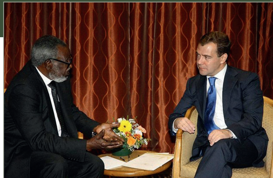
С первым Президентом Намибии Сэмом Нуйомой. 25 июня 2009 года

В день провозглашения независимости Намибии – 21 марта 1990 года – между нашими двумя странами были установлены дипломатические отношения. Политический диалог между Россией и Намибией носит активный характер. В 1998 году состоялся официальный визит первого Президента Намибии С. Нуйомы в Россию. Была подписана Совместная декларация о принципах отношений между Рос-