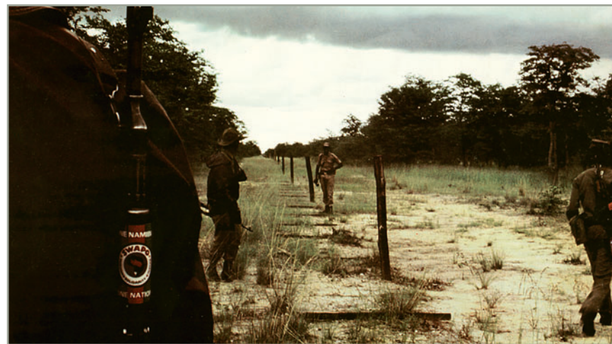
Переход отрядом СВАПО границы между Анголой и Намибией. 1978 г.