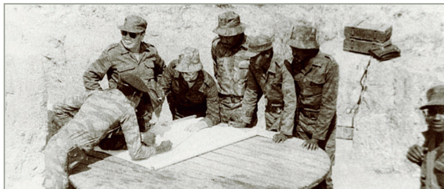
Андуло, Бие, 1987. 20-я бригада СВАПО (ПЛАН). С помощью советских советников планируется операция против УНИТА

числе продовольственную и медицинскую. Бойцы ПЛАН также принимали участие в сопровождении конвоев с продовольствием, оружием, боеприпасами и медикаментами из Уамбо. Была обеспечена бесперебойная работа электростанции, что позволяло снабжать город электроэнергией, функционировал водопровод.