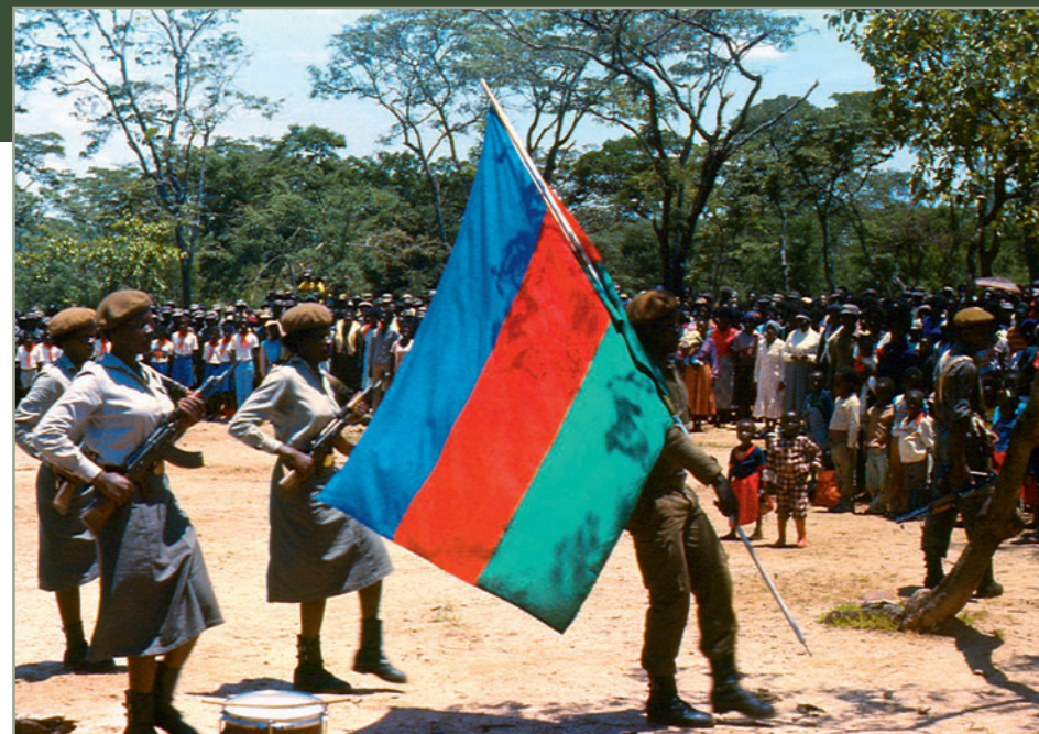
Торжественный вынос знамени СВАПО, лагерь намибийских беженцев, Кассинга, Ангола

Особое место в достижении СВАПО своей окончательной цели – независимости Намибии, сыграла Ангола. На ее территории, начиная с конца 70-х годов XX в., при помощи советских военных специалистов велась подготовка бойцов СВАПО. Победа в битве за Куито-Куанавале в 1987–1988 гг. и выход силь-