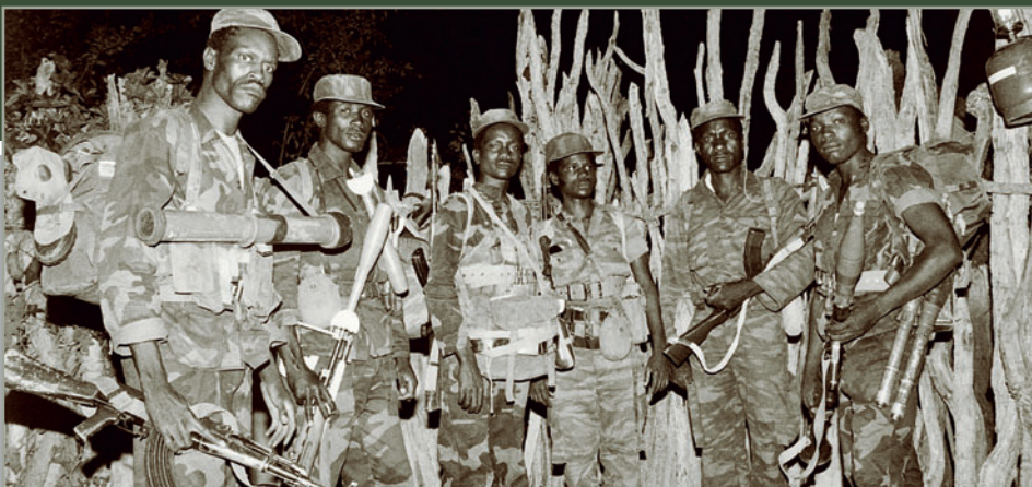
Бойцы подразделения ПЛАН на границе Анголы и Намибии

властями ЮАР политики апартеида — раздельного сосуществования рас.