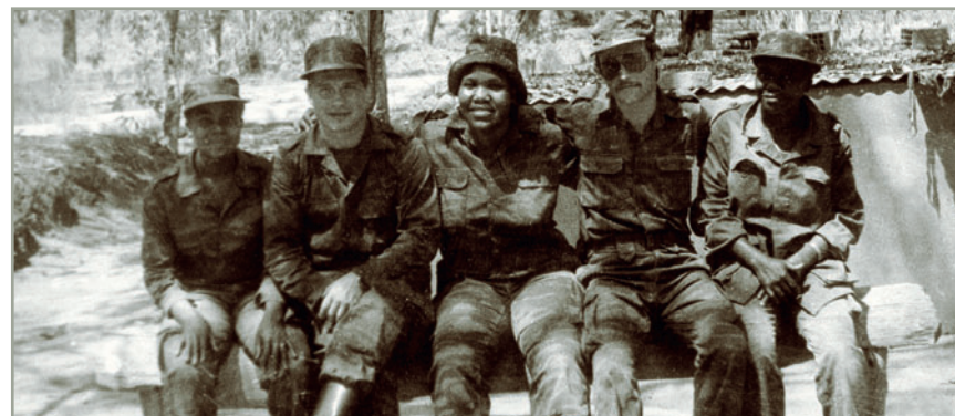
Учебный центр Джамба. На втором плане оборудованный под землей класс. 1987г.

спитале находились и проходили реабилитацию командиры и бойцы ПЛАН, получившие ранения во время выполнения боевых заданий в тылу противника, при ведении боевых действий на фронтах на территории НРА, боестолкновений с регулярными подразделениями армии ЮАР и отрядами антиправительственной группировки УНИТА. За квалифицированной помощью к советским медикам обращались и другие военные специалисты миссии СВС при СВАПО, а также члены их семей.