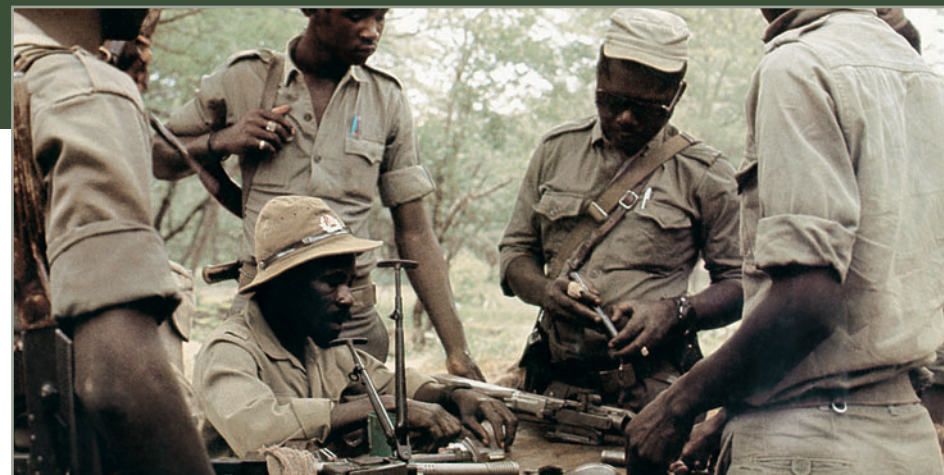
Ремонтный взвод ПЛАН, Лубанго, Ангола

В 1979 году средствами ПВО СВАПО над Ондангвой, населенном пункте на севере Намибии, в районе боевых действий подразделений СВАПО был сбит первый самолет ВВС ЮАР —