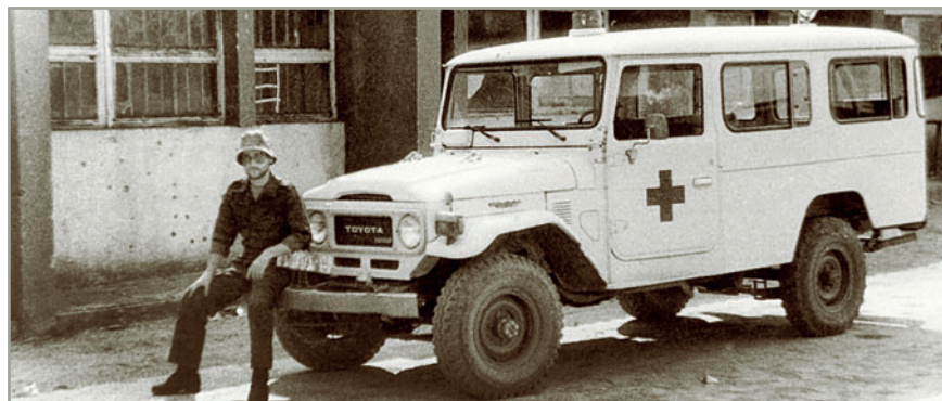
Андуло, Бие, 20-я бригада СВАПО (ПЛАН), 1987г.

В 1979 году, практически с самого первого дня создания госпиталя СВАПО, к работе в нем приступила группа советских военных медиков.