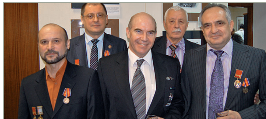
Встреча российских ветеранов с бывшим противником, капитаном ВС ЮАР Барри Фоулером

цев. В декабре 2011 года Университету Намибии была оказана безвозмездная техническая помощь на сумму 1,65 млн. долл. США путем закупки, поставки и монтажа учебно-лабораторного оборудования, передачи реактивов и материалов для химического факультета университета. В 2009 и 2011 годах по просьбе намибийского руководства Россия оказала гуманитарную помощь населению Намибии, пострадавшему от стихийных бедствий.