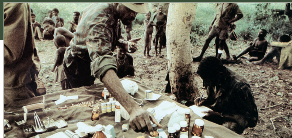
Медицинский осмотр местного населения в лагере беженцев СВАПО, Ангола

В разное время в ее составе находились представители самых разных специальностей — хирурги, рентгенологи, анестезиологи-реаниматоры, стоматологи, терапевты и гинекологи. Учитывая специфику работы, для обеспечения качественного и оперативного перевода с группой по возможности постоянно работал один переводчик. Советские специалисты ежедневно выезжали в госпиталь для проведения плановых операций, освидетельствований, осмотров и консультаций. По экстренным вызовам выезд осуществлялся в любое время суток. При необходимости военные ме-