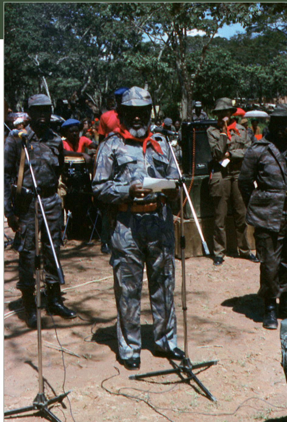
Президент СВАПО Сэм Нуйома выступает перед личным составом бригады СВАПО в Анголе

кретная долгосрочная цель: начать создание регулярных воинских формирований для будущей свободной Намибии. Сложность заключалась в том, что параллельно с решением этой задачи нужно было продолжать готовить и партизан. В программу подготовки были внесены соответствующие изменения, был осуществлен переход с трехмесячного на шестимесячное обучение. Все намибийские слушатели очередного учебного цикла были объединены в две бригады по образцу регулярной армии. Параллельно продолжалось обучение тактике ведения партизанской борьбы.