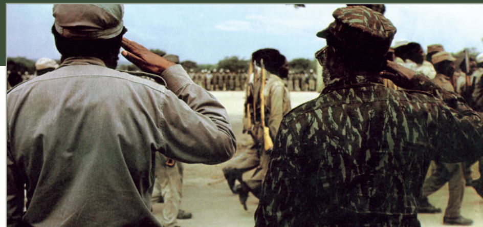
Президент СВАПО Сэм Нуйома принимает парад бойцов СВАПО. Ангола, 1978 г.