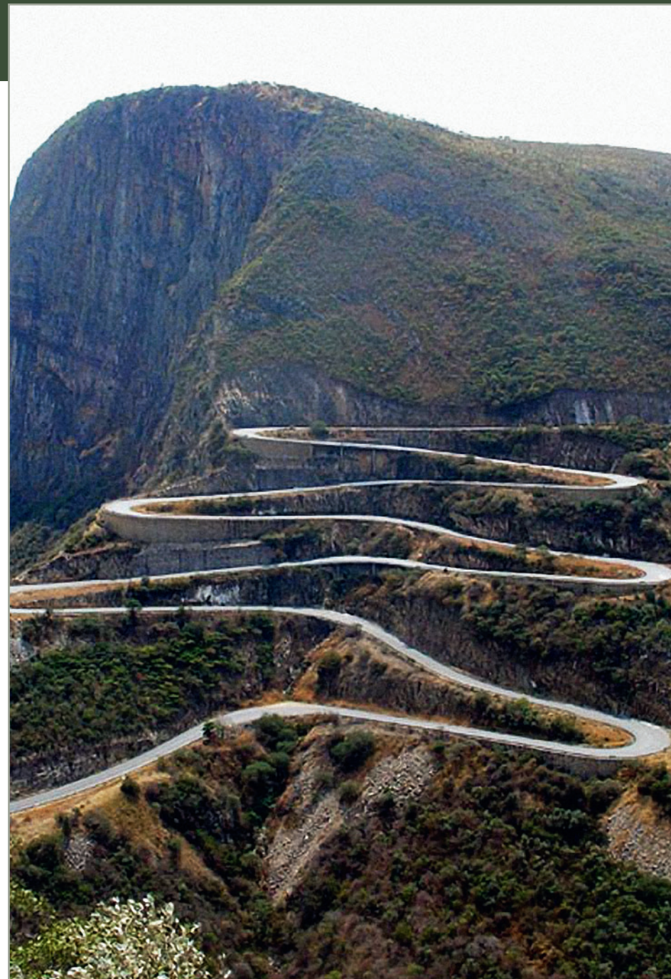
Серпантин Серра де Леба, Ангола, провинция Уила

британией была создана Организация Объединенных Наций, которая отклонила ходатайство ЮАС о включении в его состав территории Юго-Западной Африки (Намибии). В ответ ЮАС, вопреки нормам международного права, отказался передать эту территорию под опеку ООН. В 1961 году вместо зависимого от Великобритании Южно-Африканского Союза была провозглашена независимая Южно-Африканская Республика, которая вышла из британского Содружества наций. Выход был обусловлен, в том числе и неприятием европейцами провозглашенной новыми