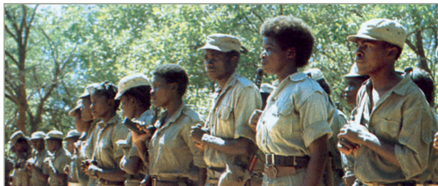
Лагерь партизан ПЛАН (СВАПО) в Анголе, начало 80-х гг. XX в.

Юго-Западная Африка) решением Лиги Наций была передана под управление ЮАС в качестве «подмандатной территории», что означало, по сути, продолжение колониального господства. В 1946 году в результате победы антигитлеровской коалиции во главе с Советским Союзом, США и Велико-