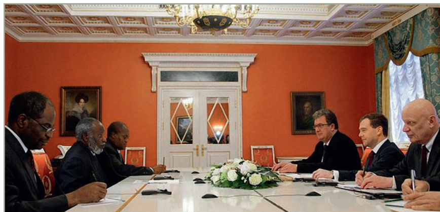
В ходе встречи с первым президентом Намибии Сэмом Нуйомой. 5 февраля 2010 года

14 сентября 1989 года Сэм Нуйома вернулся в страну. На проведенных 6 ноября того же года выборах в законодательное собрание СВАПО получила 57% голосов и 41 место в пар-