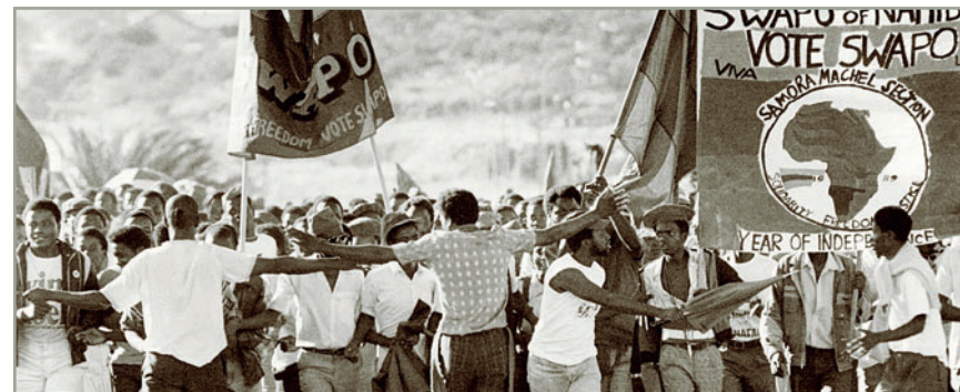
Демонстрация в поддержку СВАПО перед выборами, Намибия