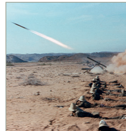
Тренировочные пуски советских установок «Град П» подразделениями СВАПО. Ангола, пустыня Намиб

После ухода СВАПО Андуло перешел в руки УНИТА и был превращен в штаб-квартиру Ж. Савимби. В декабре 1998 года после нарушения УНИТА Лусакских соглашений начались крупномасштабные боевые действия. Лишь в сентябре 1999 года в результате наступления правительственных войск город был взят и одна из самых крупных баз антиправительственной группировки УНИТА в Анголе прекратила свое существование.