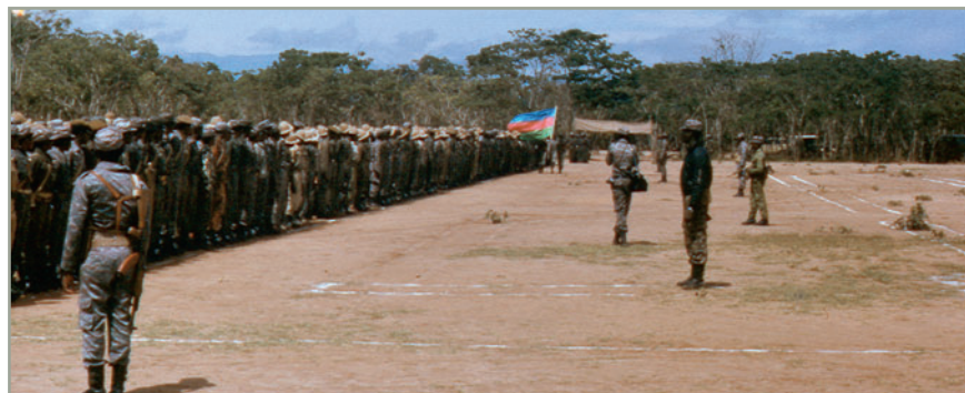
Смотр бригады СВАПО (ПЛАН) в Анголе, УЦ им.Т.Хайнеко