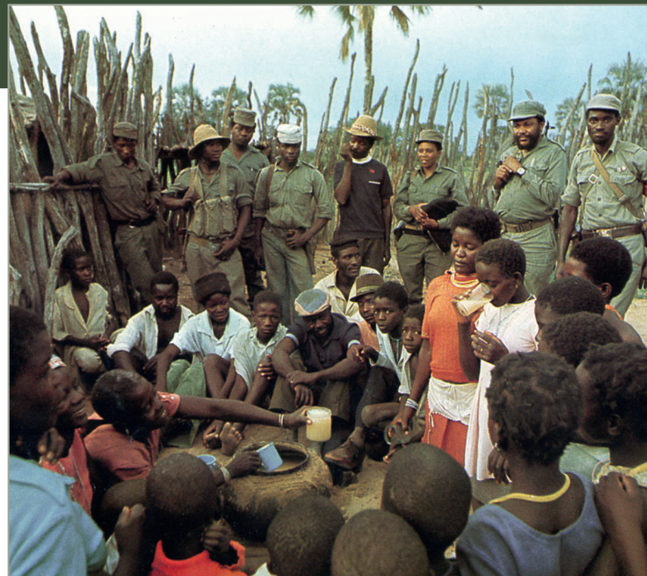
Солдаты СВАПО в освобожденной от юаровских оккупантов деревне УНИТА

С 1983 года в Андуло постоянно находились советские специалисты из состава 1-й и 2-й бригад ПЛАН, дислоцировавшихся в Лубанго и переводчики. С их помощью и под их руководством была организована эшелонированная система обороны города, оборудованы укрытия и блиндажи, отрыты траншеи и соединены ходами сообщений. Для координации действий была налажена и поддерживалась постоянная связь с миссией советских военных советников при ФАПЛА в Уамбо, и советников при СВАПО в Лубанго, руководством кубинских войск организовано взаимодействие с местными властями