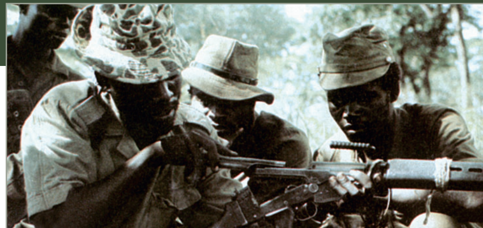
Изучение материальной части курсантами учебного центра СВАПО (ПЛАН), Ангола

В 1960 году на XV сессии Генеральной Ассамблеи ООН СССР стал инициатором принятия Декларации о предоставлении независимости колониальным странам и народам. Этот шаг оказал решающее влияние на подъем борьбы намибийского народа за свою независимость и освобождение. 19 апреля 1960 года в результате реорганизации ОНО было создано новое освободительное движение намибийцев — Народная организация Юго-Западной Африки (СВАПО), ставившее своей целью освобождение Намибии от колониальной зависимости. На учреди-